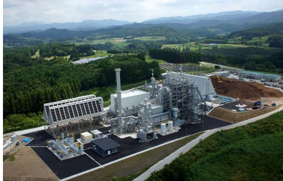
(写真：豊後大野発電所)

エフオングループでは、全国5か所の発電所で、国内の山林で発生した未利用木材など、今まで利用されてこなかった木材を活用しバイオマス発電を行い、山林の適切な資源循環を目指しています。